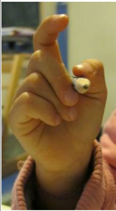
Tenue de crayon droitiers/res