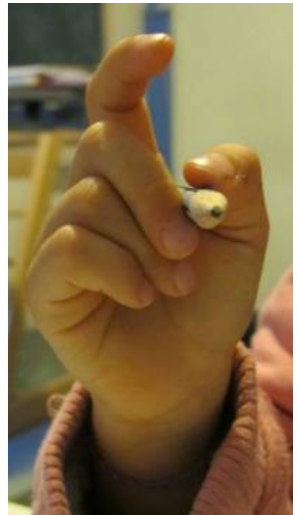
points bleus droitiers Points bleus pour