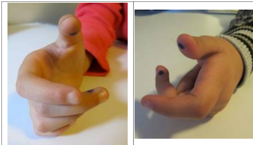
Points bleus, pour un/e droitier/e

Le premier point se trouve sur la pulpe du pouce