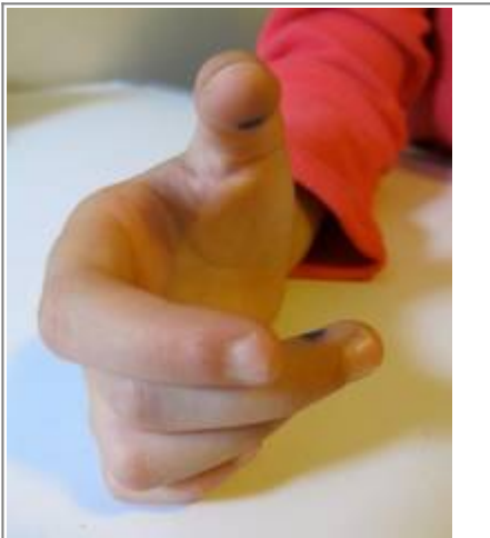
Points bleus, pour un/e droitier/e

Le premier point se trouve sur la pulpe du pouce